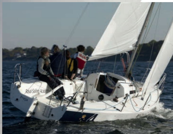
Cockpitet er perfekt stort til en besætning på fire voksne sejlere eller f.eks. fem kvinder eller unge.