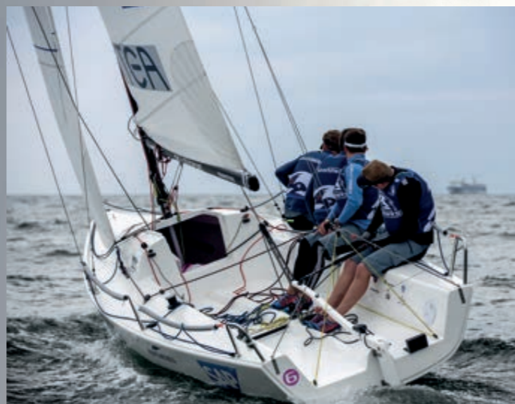
Der er god plads til fire voksne i cockpitet på en J/70. Fokken kan hales uden brug af spillet.

"Det er min holdning, at skal båden tiltrække og udfordre unge, og i høj grad bruges til kapsejls, så er J/70 et godt valg, mens man nok skal kigge mere efter en J/80, hvis båden mest skal benyttes til skolesejls, klubsejls på tværs af generationerne og tursejls. Med en J/80 kan man også altid komme ud og få god kapsejls. Både nationalt og internationalt," vurderer Sten Mohr.